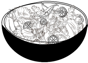
Ensalada del Jardín

Los niños disfrutan ayudando en la cocina. Cuando los niños ayudan a preparar los alimentos, es más probable que los prueben. Los cuchillos para mantequilla y los cuchillos de plástico son una forma segura para que los niños corten frutas y vegetales. Enjuagar las frutas y verduras es otra actividad divertida y segura para los niños. ¿Cómo podría su hijo(a) ayudar a preparar los alimentos en casa?