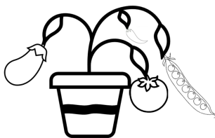
Ideas para jardinería

Sabía usted que es mas probable que los niños que cultivan un jardín quieran probar los alimentos que cultivan?